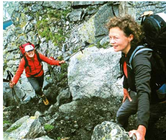
Am Landshuter Höhenweg