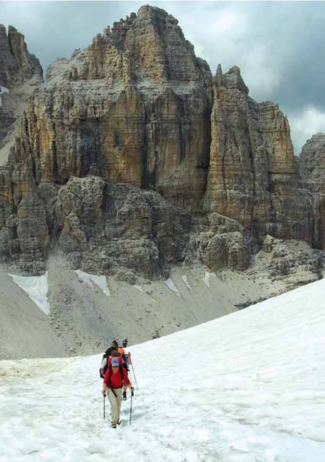
Auf dem Weg zur Boéhütte

zum Grödnerjoch geht es noch durch das Felsenlabyrinth des Col Turond.