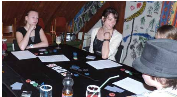
Casinoabend oder schon -nacht?

... Beim Hütt'n-Casinoabend im April ging es schick her. Für die Jungs galt Krawattenpflicht, die Mädels kamen im Kleid. Nachdem wir die Regeln von Poker und Roulette geklärt hatten, konnte es losgehen: Wir zockten wie die Profis und genossen dabei unsere alkoholfreien Cocktails.