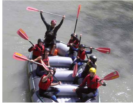
Raften auf der Saalach