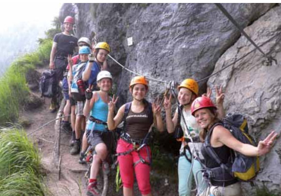
Die Truppe am Grünstein-Klettersteig, Königsee