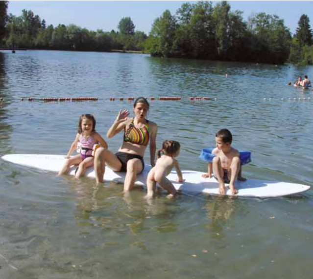
Mal schau'n wieviel Zuladung der Kahn verträgt

pass ließen wir sie dann in die Lüfte steigen. Zum Glück war im Rucksack auch noch Platz für einige Stärkungsgummibärchen, denn der Auf- und Abstieg mit seinen gut 500 Höhenmetern hatte es schon in sich. Aber schließlich sind alle wieder gut unten „gelandet“.