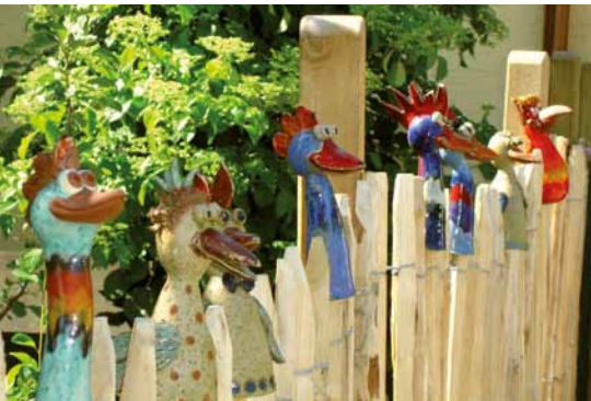
Kleine Überraschungen aus unserem Weg I