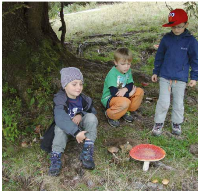
Ob der wohl für eine Schwammerlsupp'n taugt?