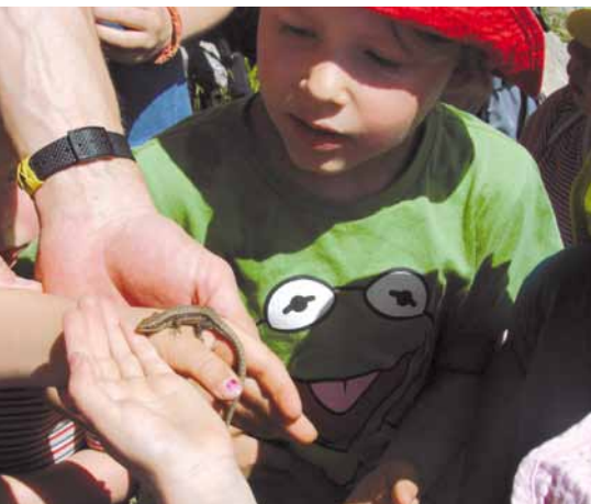
Tierisch spannend was es mit der Familiengruppe alles zu entdecken gibt

Nach dem Pfingsthochwasser sind wir am ersten sonnigen Wochenende im Juni zum Wilden Kaiser aufgebrochen. Unser Ziel war, von Going aus den Schleierwasserfall zu erkunden. Durch den vielen Regen der letzten Wochen war der Wasservorhang über der natürlichen Felsgrotte sehr breit und faszinierend.