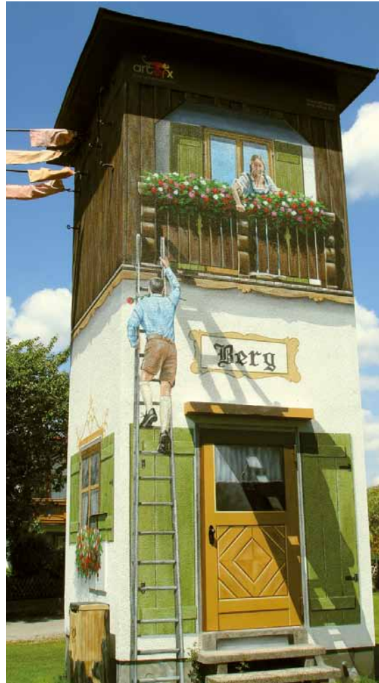
Kleine Überraschungen auf unserem Weg II