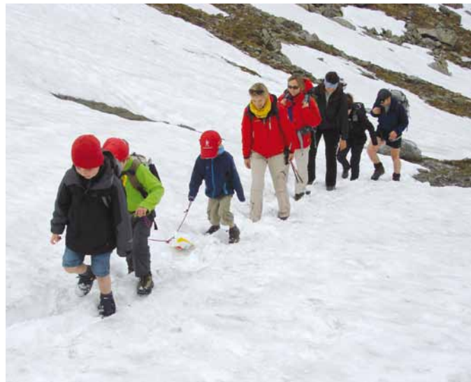
Den Gespenster auf der Spur

Das Wetter hatte es auch gut gemeint als wir Ende August unsere „Berg-Drachen“ und einige andere „unbekannte Flugobjekte“ in den Rucksack gepackt haben. Am Gipfel der Hochalm am Achen-