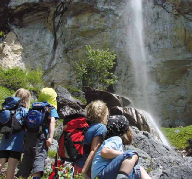
Da oben ist doch wer nicht dicht ...

Die Klettercracks, welche neben dieser Freiluftdusche an der überhängenden Wand ihr Können demonstrierten, haben uns so motiviert, dass uns die mehrstündige Wanderung auf den vielen kleinen Waldwegen und Steigen gar nichts mehr ausgemacht hat.