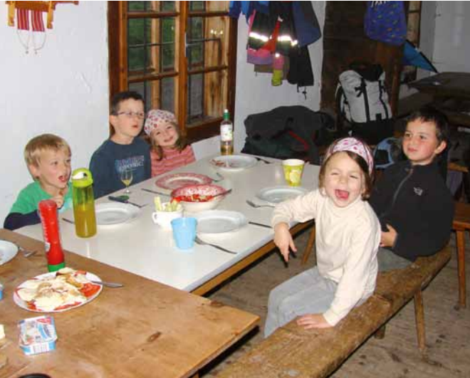
Wann gibt's denn was zu essen?

Den Gipfel haben wir nicht ganz erreicht weil der Weg gesperrt war und es außerdem zu tröpfeln begann. Trotzdem haben wir auf der Wiese noch die mitgebrachten Drachen ausgepackt. Der Wind war zwar sehr schwach, aber solange die Papas schnell genug liefen, stiegen die Drachen wenigstens etwas in die Luft. Auf dem Rückweg sind wir dann doch noch etwas nass geworden, aber Dank dem noch warmen Kachelofen und Kakao waren bald alle wieder warm und trocken. Den Nachmittag ließen wir gemütlich in und um die Hütte herum ausklingen.