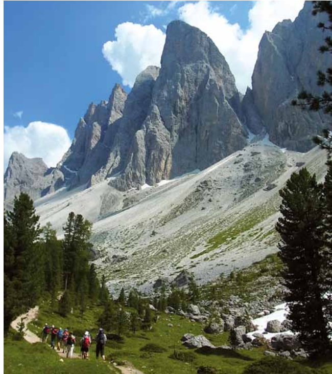
Auf dem Adolf-Munkel-Weg unter den Geislerspitzen

Unsere Stationen dorthin sind Kreuzjoch und Wasserscharte, der steile Geröllweg zur Forcella della Roa in zügigem Anstieg und der Übergang über die Forcella Forces de Sieles. Die Erholungspause danach vor dem Abstieg