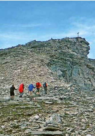
Unterhalb des Kraxentragers

Ausgangspunkt der Tour ist der Brennersee, wo am 18. August zwei Frauen und fünf Männer bei bestem Wetter die Rucksäcke schultern.