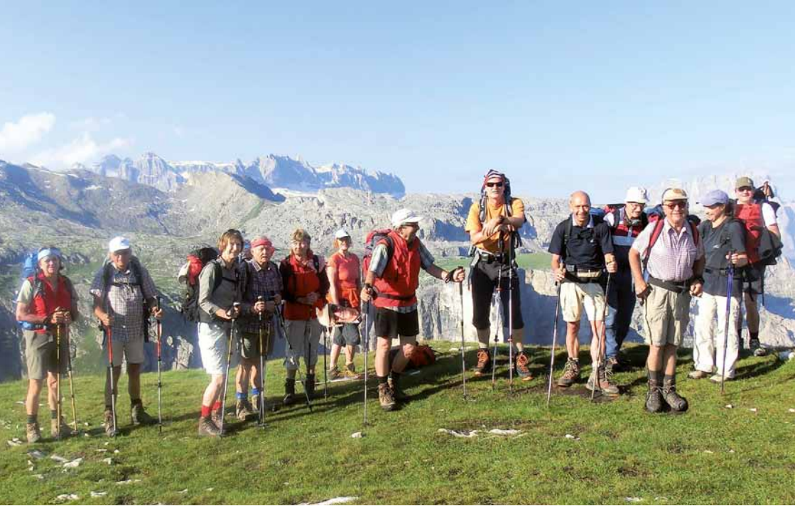
Unsere Gruppe mit der Puez- und Geisler Gruppe im Hintergrund

Joch. Nach diesem mühsamen Wegabschnitt sind wir erleichtert und steigen motiviert zur Langkofelscharte und der Toni-Demetz-Hütte auf. Die Belohnung für die Mühen ist ein herrlicher Ausblick auf die schneebedeckte Marmolada und ein kühles Bier auf der Hütenterrasse.*)