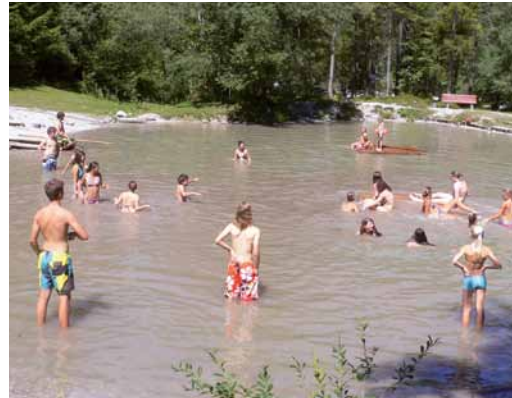
Baden im saukalten Gumpenwasser