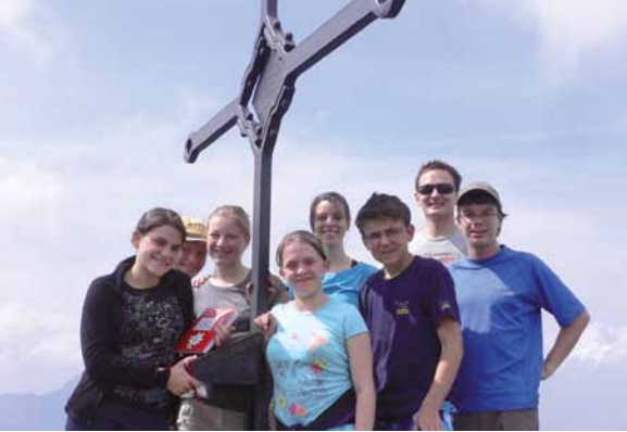
Der Brünstein ist besetzt