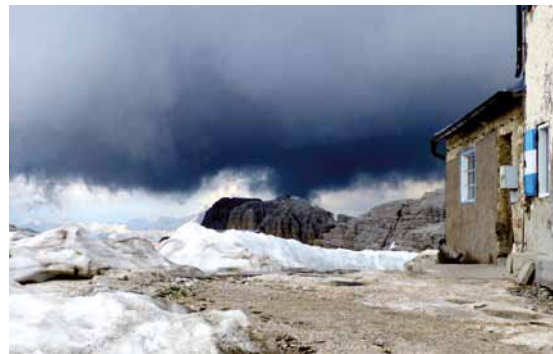
Wolken, Blitz und Donner am Piz Boé

Unsere nächste Station, das Sella-joch, erreichen wir abenteuerlich über einen wilden Gebirgsbach und auf einem Marsch hinauf zum