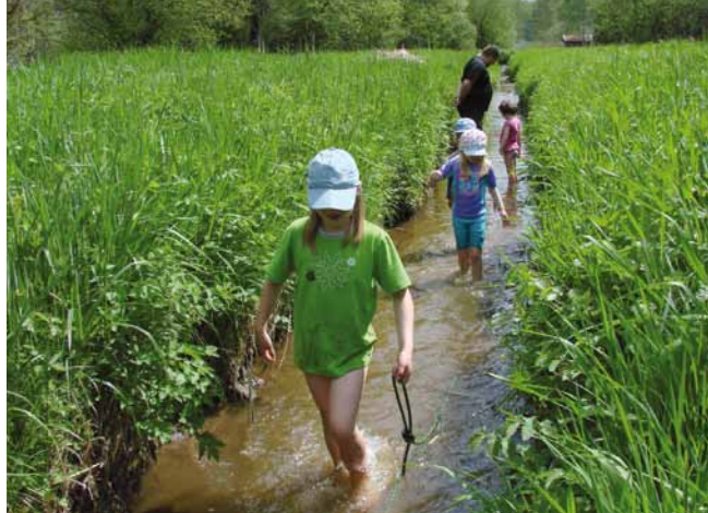
Was hilft am besten gegen heiß gelaufene Füße?

Die Familiengruppe der Sektion ist ein loser Zusammenschluss von Kindern zwischen ca. 3 und 6 Jahren und ihren Eltern. Wir treffen uns einmal im Monat, um abseits der bekannten Wege aus Kinderzimmer und -garten auf Entdeckungstour zu gehen. Im Moment sind die meisten der Kinder noch nicht im schulpflichtigen Alter, aber das wird sich bald ändern und die Zielgruppe der Familiengruppe „altert“ dann natürlich mit. Unsere Unternehmungen führen uns mal direkt vor die Haustür, mal wenige Zug- oder Autostunden in die weitere Umgebung, aber ganz sicher genau dorthin, wo es gemeinsam was Spannendes zu erleben gibt.