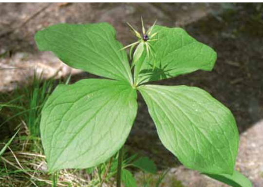
Die seltene und giftige Einbeere

Die sechs Teilnehmer der Wanderung wollen von Traudl Graebner etwas lernen. Sie ist Expertin für Pflanzenkunde und ausgebildete Pharmazeutin.